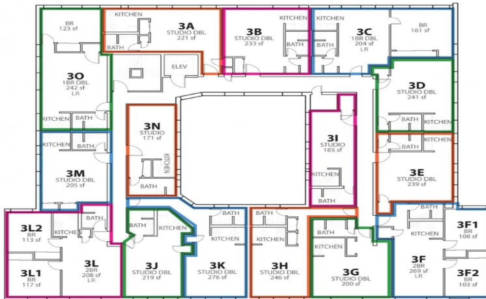
Figura 3. Planta dos andares dos quartos da moradia estudantil Watt Hall* da Columbia University, com estúdios, quartos duplos, banheiros e cozinha. Imagem meramente ilustrativa.

*Observação: A Columbia se reserva o direito de indicar outra residência estudantil, nas proximidades do campus, caso seja necessário.