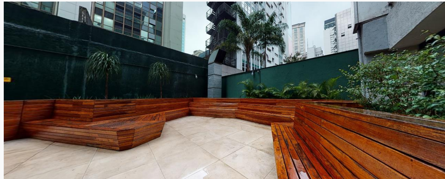
Área externa da Biblioteca | Térreo