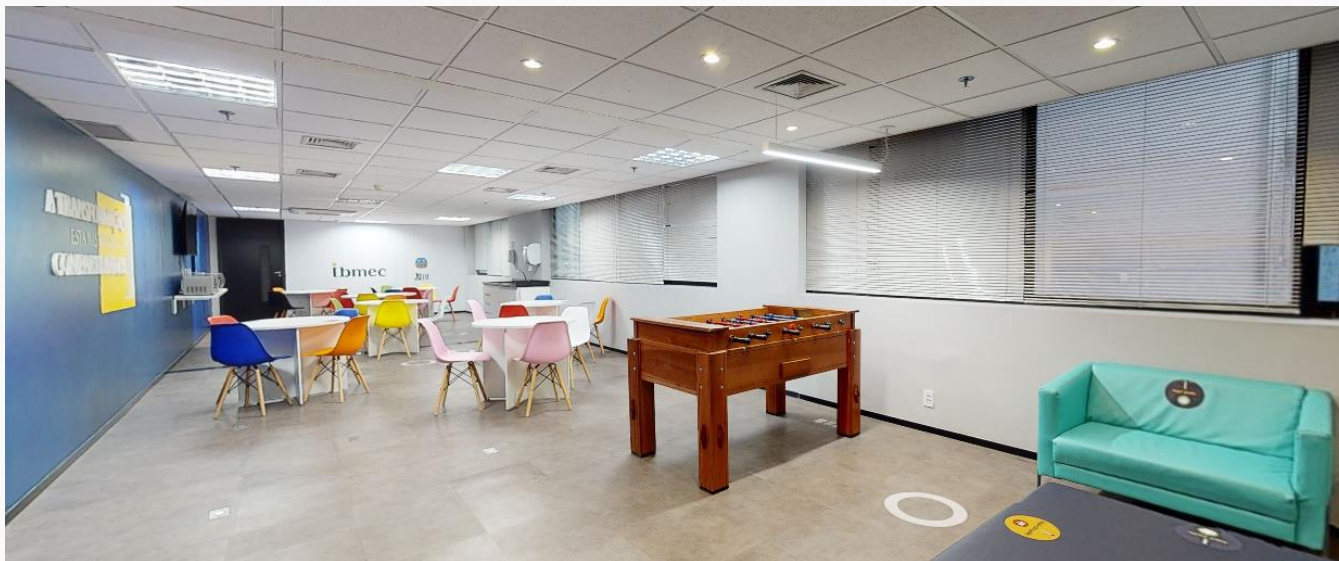
Sala de Convivência | 1º Andar