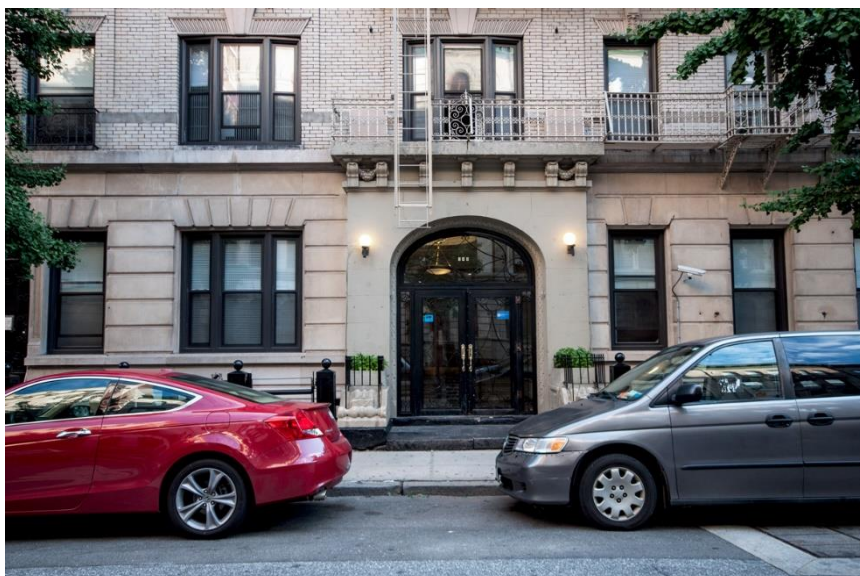
Figura 1: Faixada da acomodação estudantil Watt Hall da Columbia Law School (Imagem meramente ilustrativa).

Serão disponibilizados 60 (sessenta) quartos compartilhados com banheiros individuais; e 30 (trinta) quartos compartilhados com banheiros compartilhados.