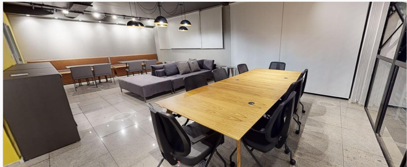
Ibmec Hubs | Prédio 2 | 1º andar