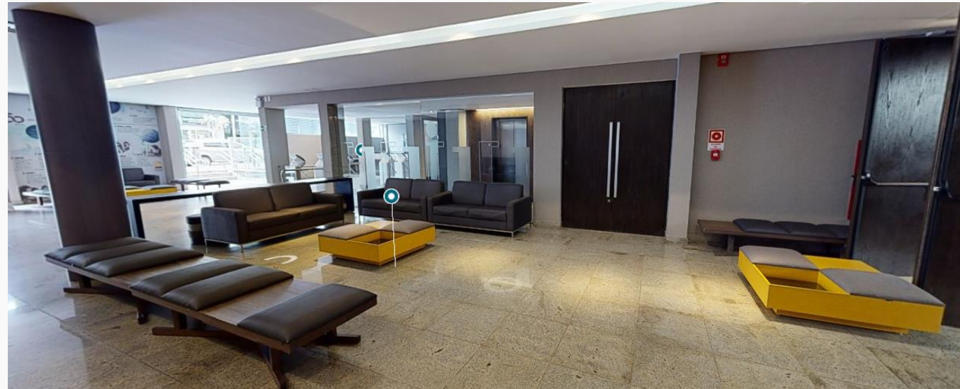
Foyer | Prédio 1 | Térreo