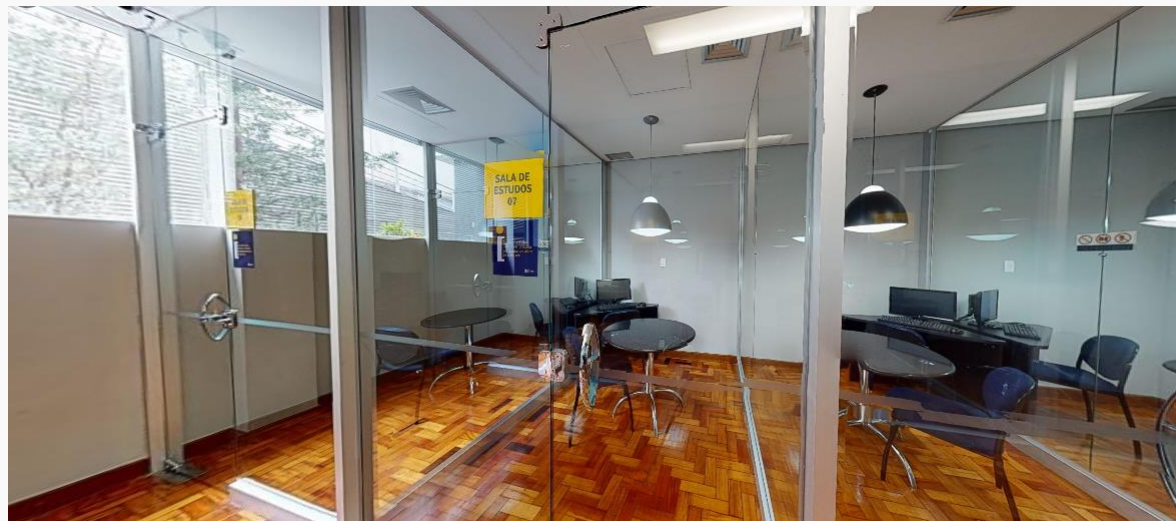
Salas de Estudo na Biblioteca | Prédio 1 | Térreo