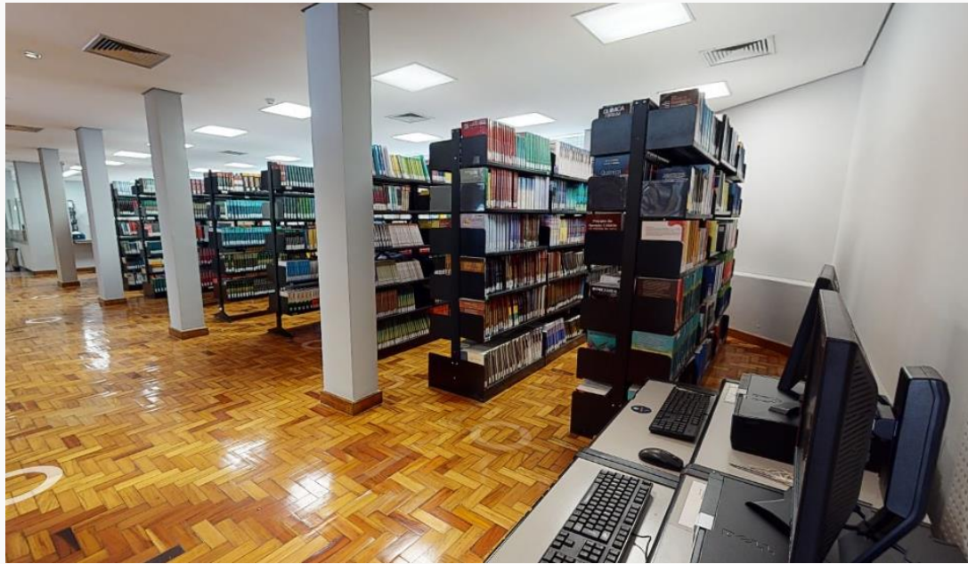
Biblioteca | Prédio 1 | Térreo